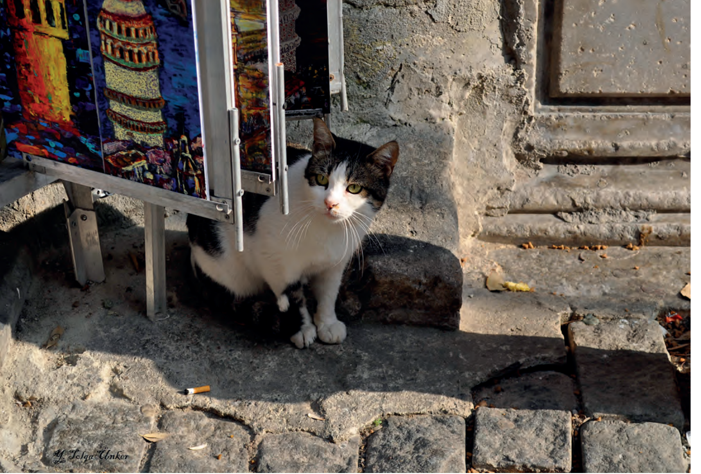
Yusuf Tolga Ünker Galatalı Kedi, 42 x 61 cm Fotoğraf