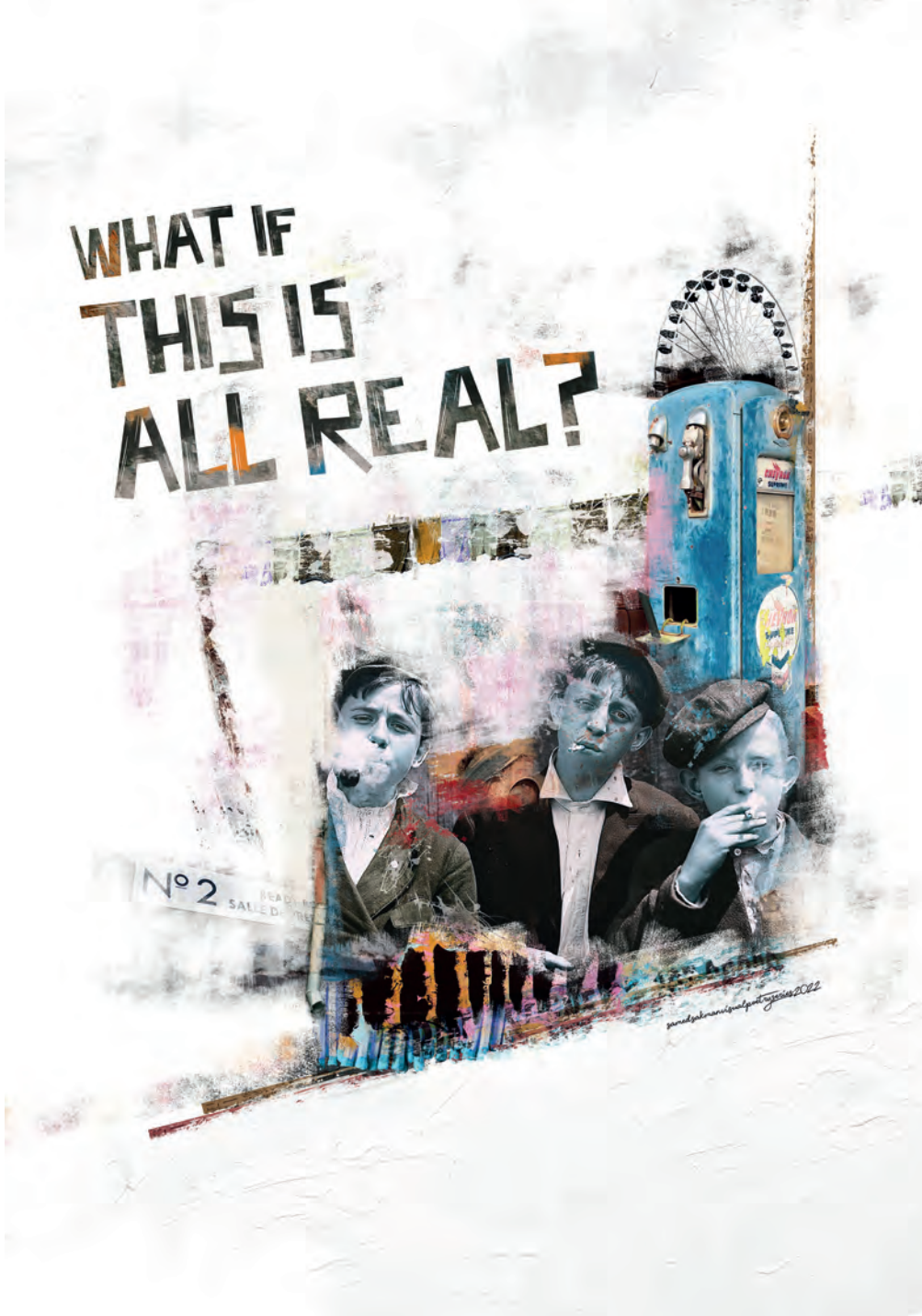
Samed Sakman What If This Is All Real? 70 x 100 cm Afiř Tasarımı