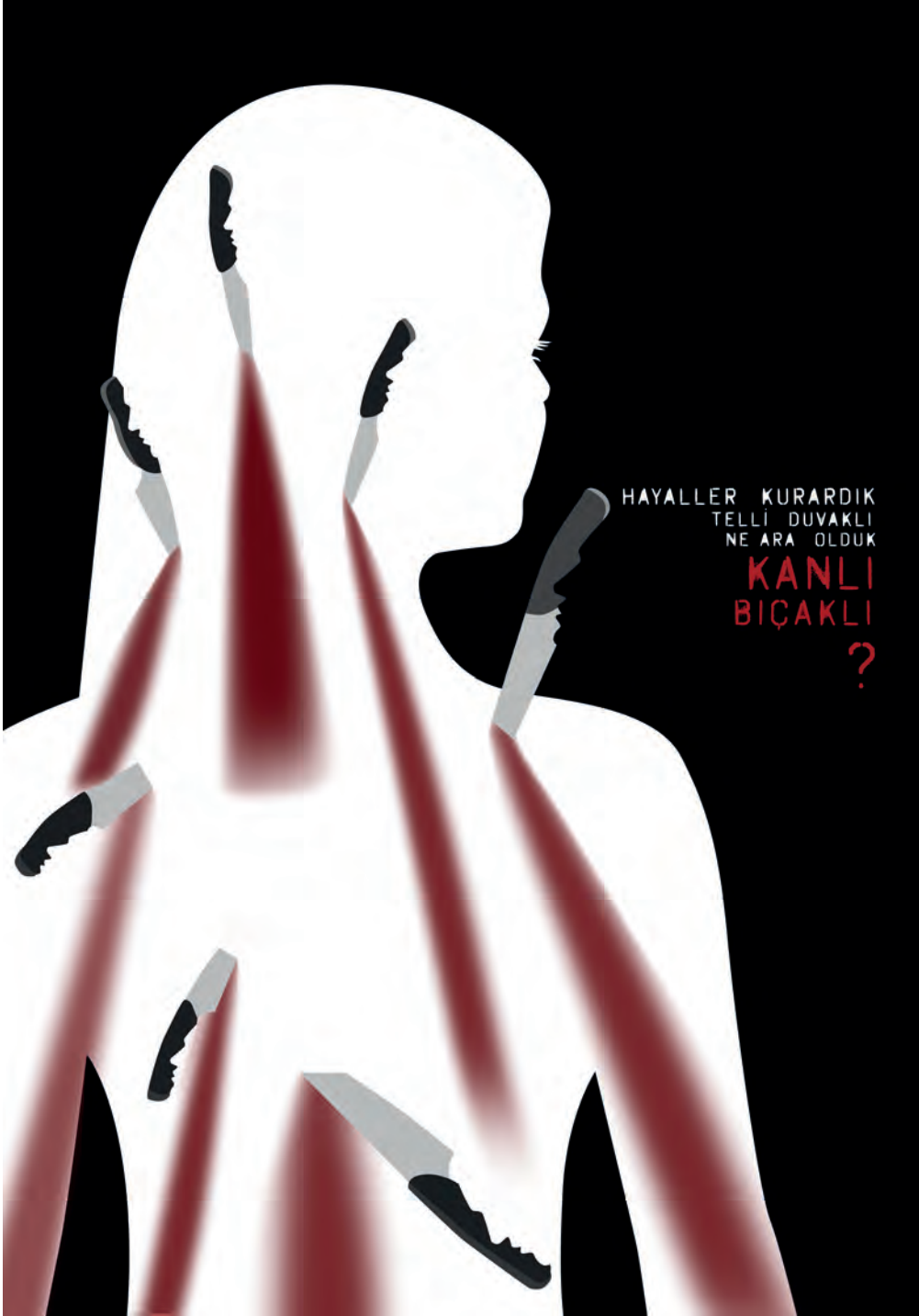
Hülya Demir İsimsiz, 70 x 100 cm Grafik Tasarım