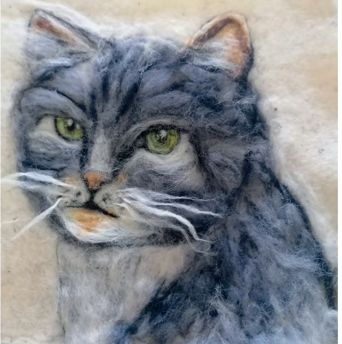
Emel enet İsimsiz, 30 x 30 cm İğneli Kee