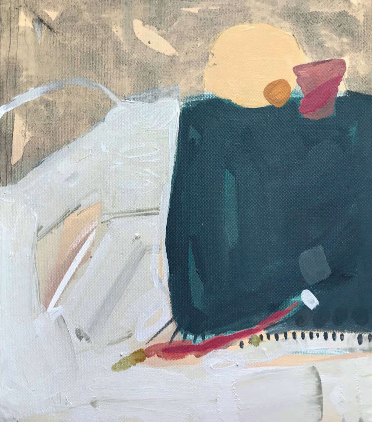
Yudum Akkuş Gündüz Gün Batarken, 35 x 50 cm Karışık Teknik