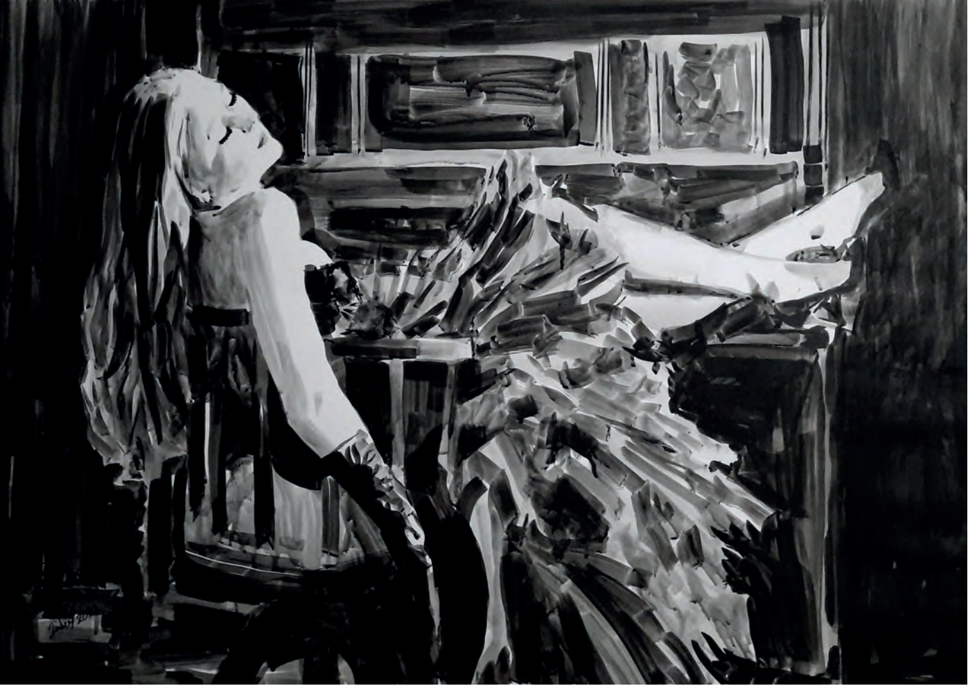
Gülser Aktan Tül Etekli Kadın, 50 x 70 cm Kağıt Üzerine Lavi