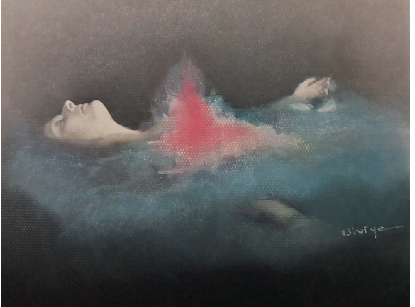
Ulviye Özönder Ruhun ırpınıřı, 35 x 50 cm Kağıt Üzerine Karıřık Teknik