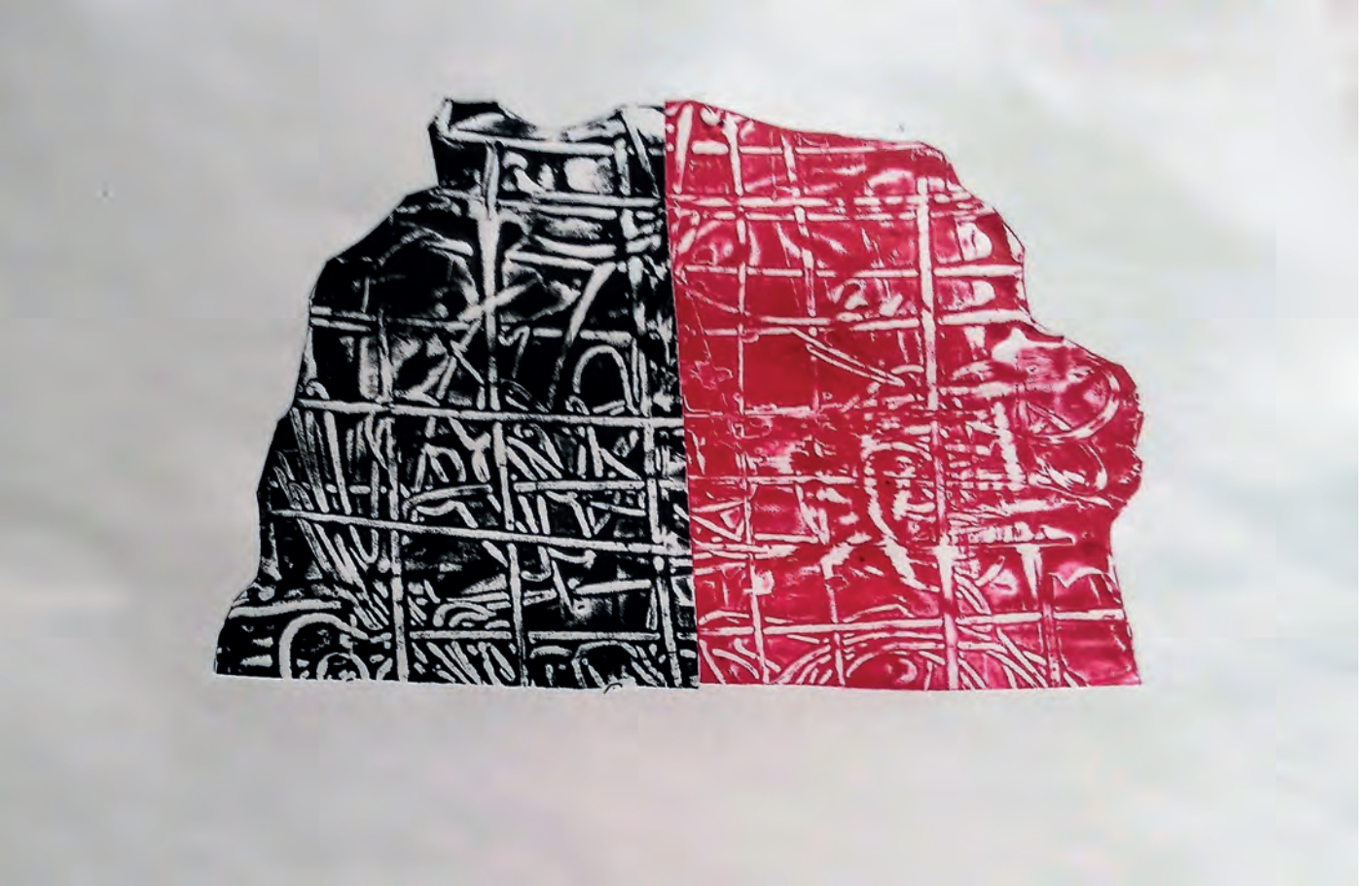
Umut Demirel İsimsiz, 25 x 30 cm Karıřık Teknik Baskı