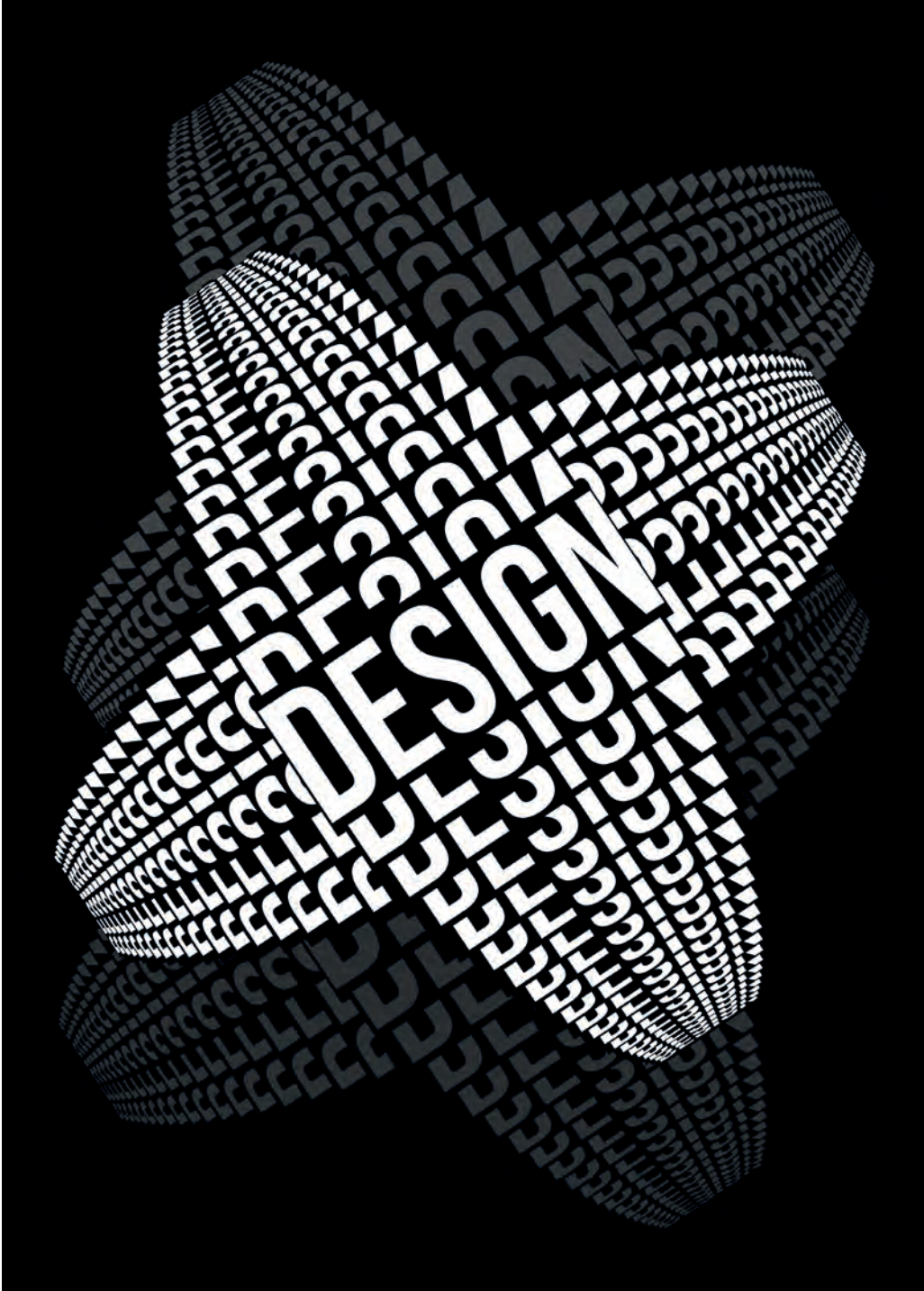
Pınar Ongan Design, 25 x 35 cm Dijital Tasarım