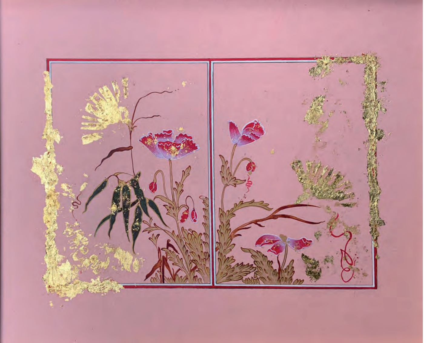
Sevda Emlak Gelincik, 27 x 21 cm Natüralist Çiçek Tasviri/ Cilt Kabı Tezhibi