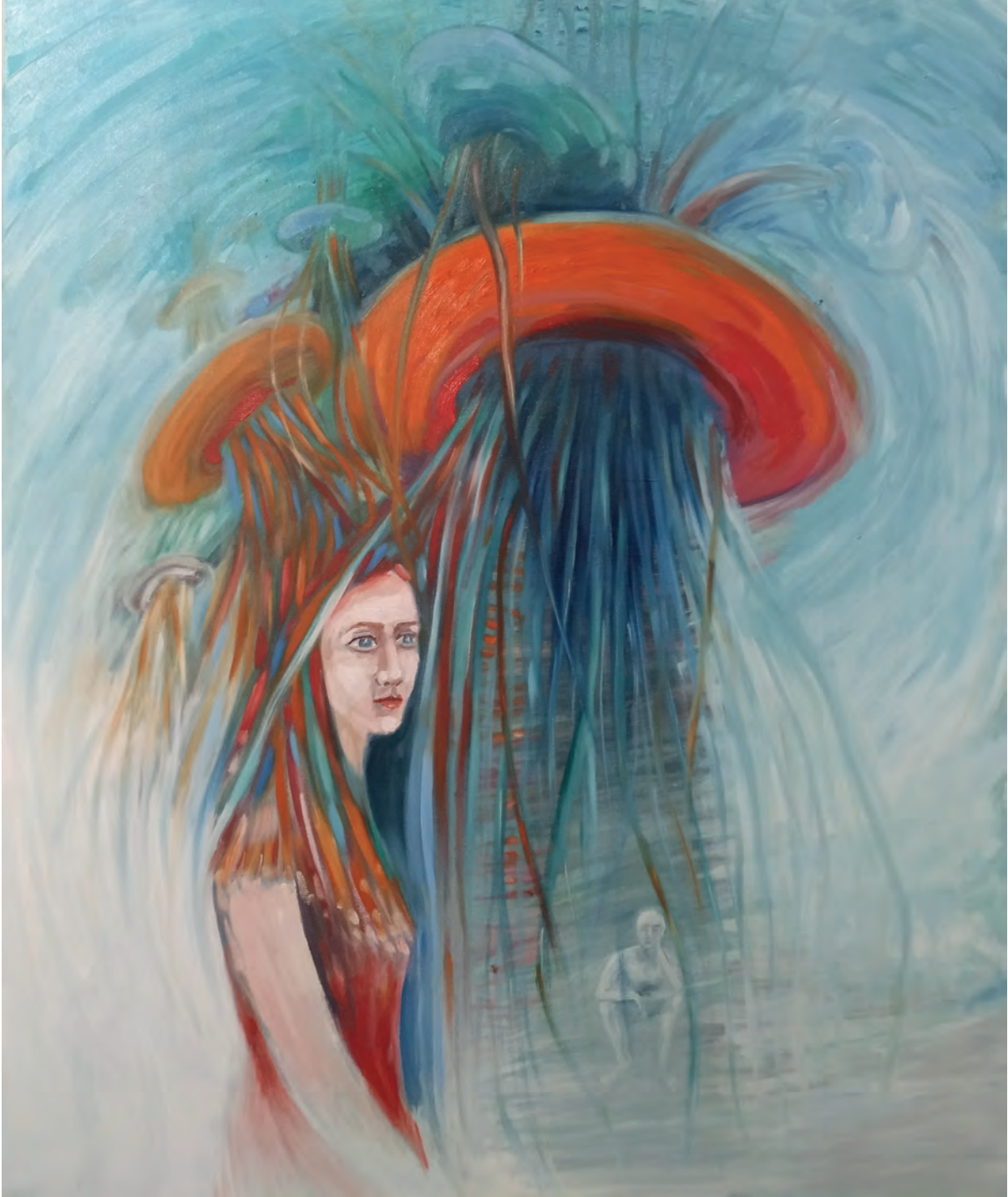
Yavuz Selim Dinçer Ben ve Ötesi, 60 x 70 cm Tuval Üzerine Yağlıboya