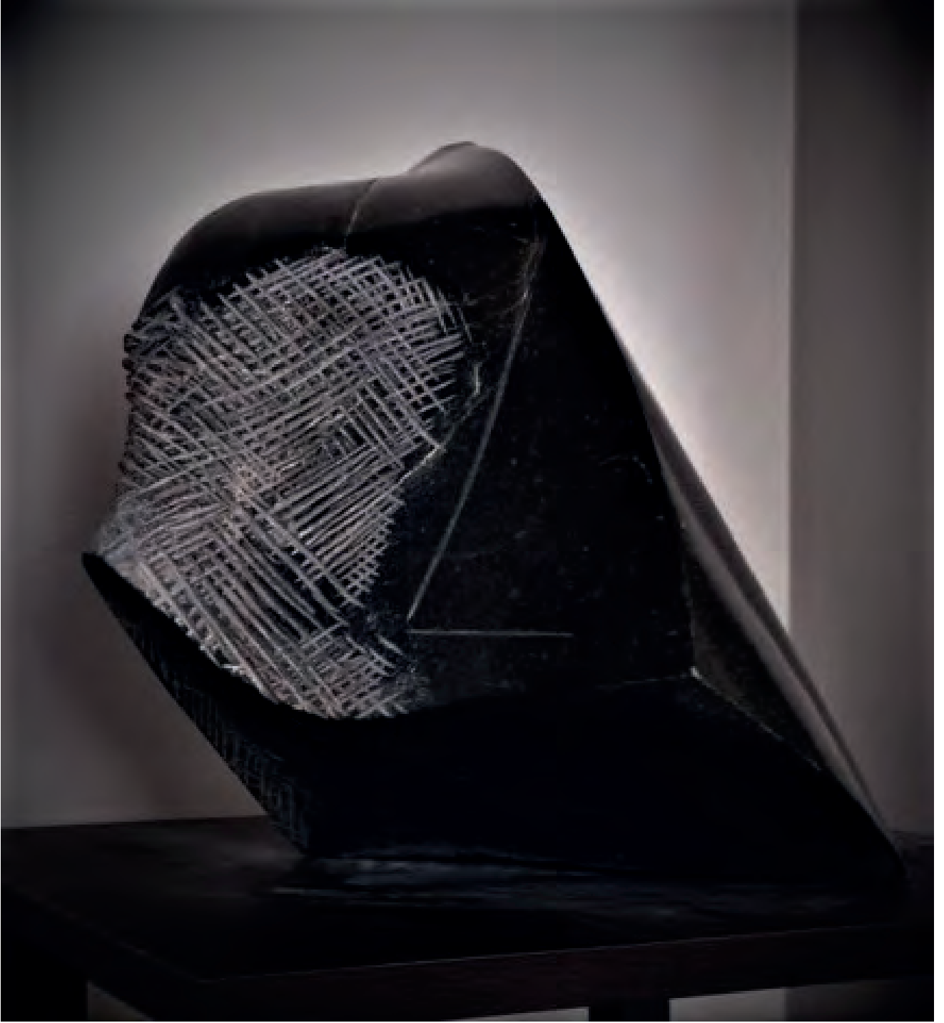
Metin Kar Yada, 33 x 32 x 20 cm Granit