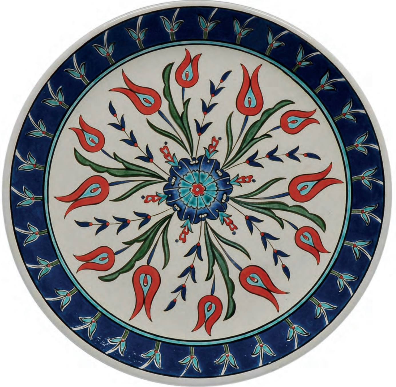
Fazilet Özdemir Gayret, Çap: 30 cm Sıraltı Çini Tekniđi