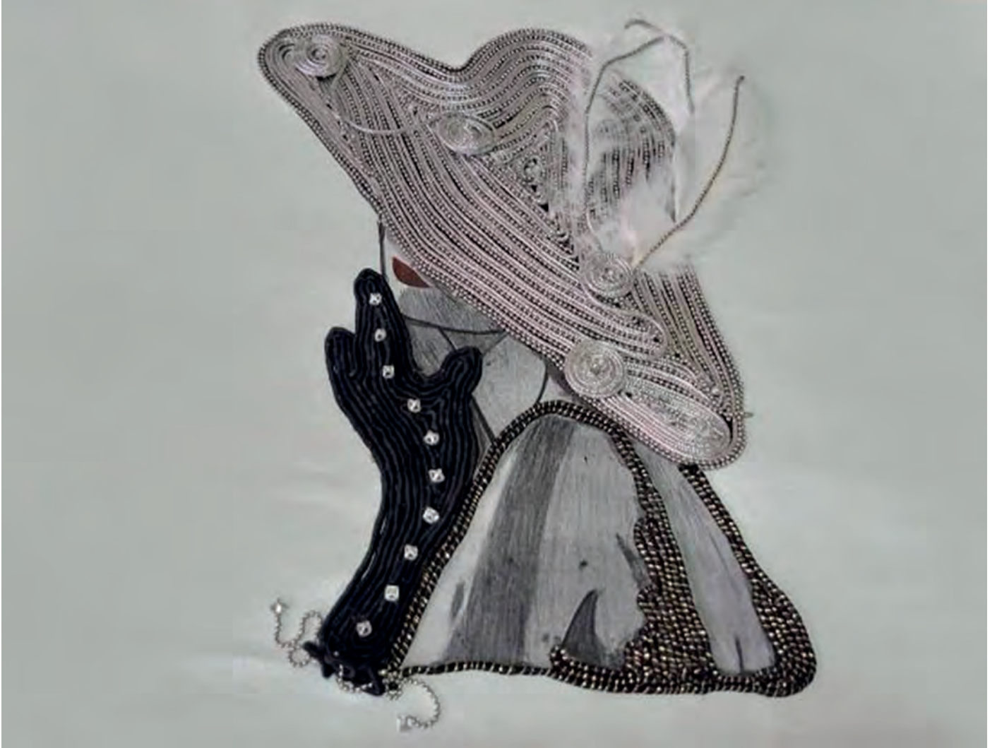
Arzu Pilevne Kuřku, 32cm x 22 cm Karma Teknik